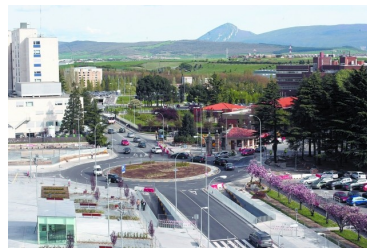
Imagen de la zona hospitalaria de Pamplona.

Salud persigue reducir un 22% el presupuesto, de 1,5 millones a 1,1, e Interior negocia la adjudicación