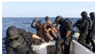
Impacto de una granada

esquifes por bandidos somalíes tan solo 12 días después de que se resolviera con éxito la liberación del 'Alakrana', que el año pasado permaneció secuestrado durante 47 angustiosos días.