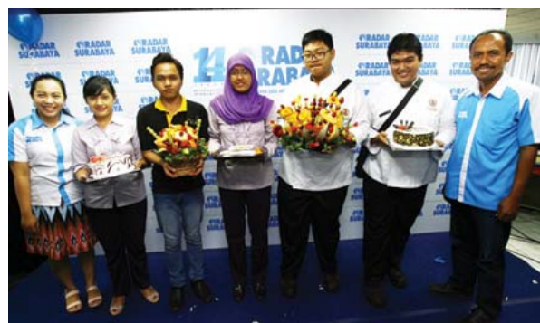
KREATIF: Perwakilan mahasiswa Majapahit Tourism Academy membawa buah hasil kreasinya.