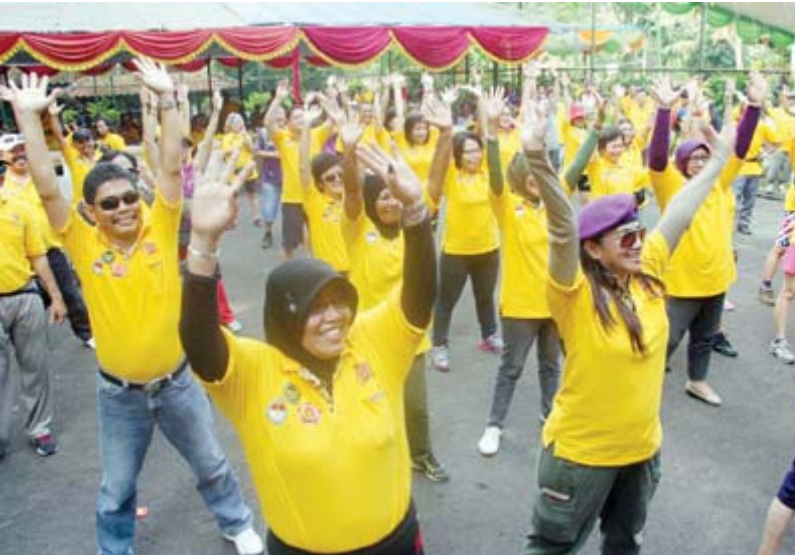
SENAM: Seluruh peserta ikut senam bersama sebelum berangkat.