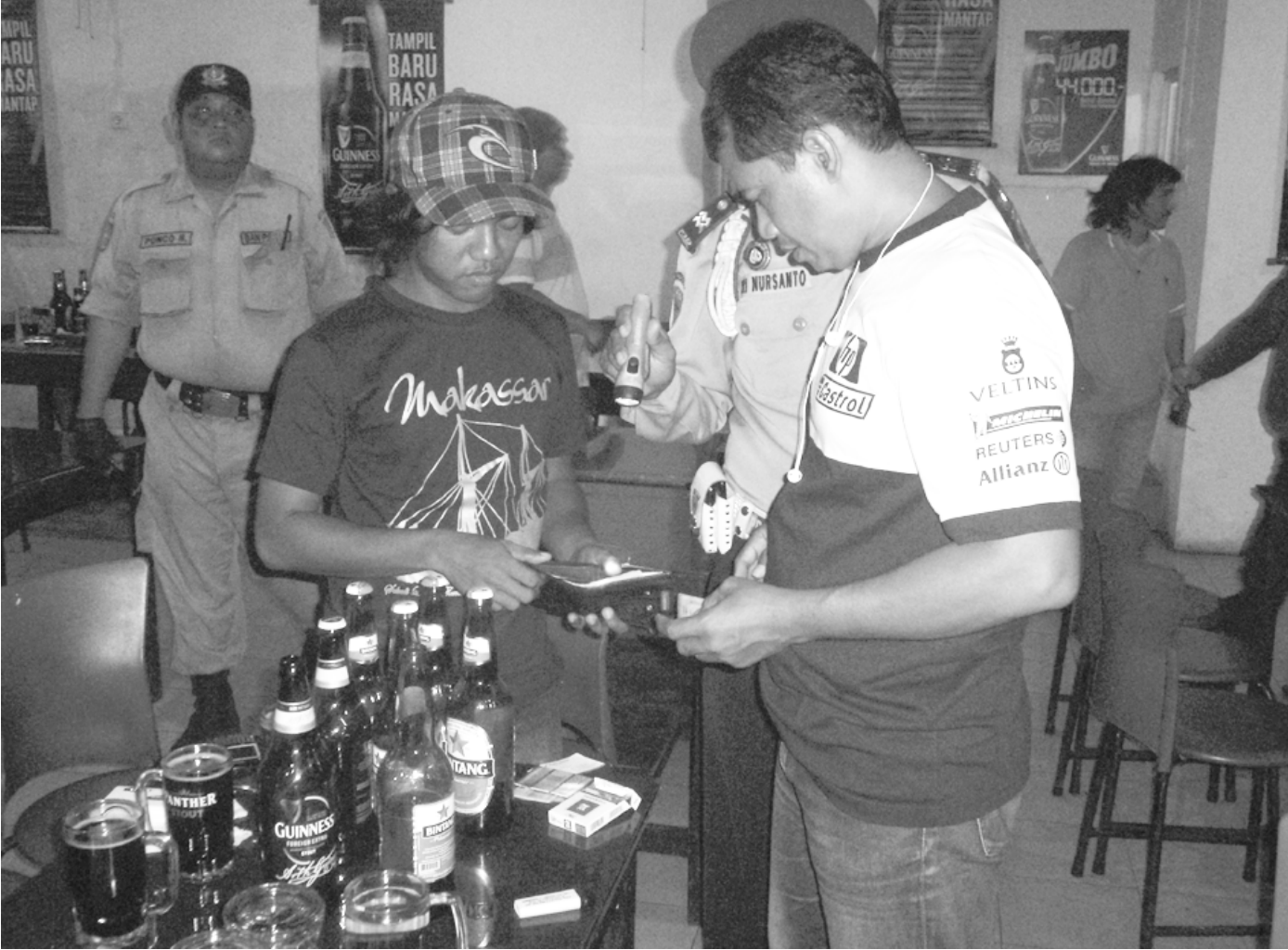
ANTISIAPASI: Polrestabes Surabaya melakukan razia di beberapa kawasan di Surabaya seperti jalan Panglima Sudirman dan tempat hiburan di jalan Kayoon.