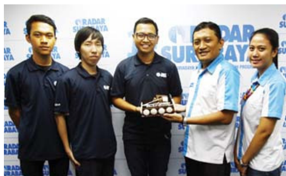
TIM DBL: Perwakilan dari DBL juga ikut meramaikan Ulang Radar Surabaya.