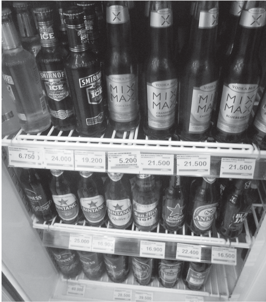
TUNGGU DISITA: Disperdagin akan menyita minuman beralkohol di supermarket maupun minimarket yang masih bandel menjualnya.

Dalam razia tersebut, Widodo menyebutkan bahwa pihaknya akan menerjunkan tim penyidik dari disperdagin. Tim tersebutlah yang akan memeriksa satu per satu minimarket yang masih menjual mihol. ”Mengapa tidak dari satpol PP atau kepolisian, tapi dari penyidik kami? Sebab, yang dirampas adalah produk niaga. Kalau kepolisian,