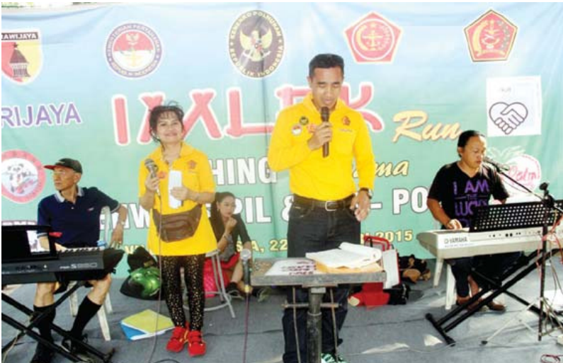
KARAOKE: Setibanya di tempat finish, ada yang berkaraoke ria.