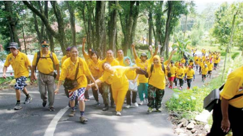
BERANGKAT: Peserta Hashing meninggalkan villa menempuh rute yang ditentukan.