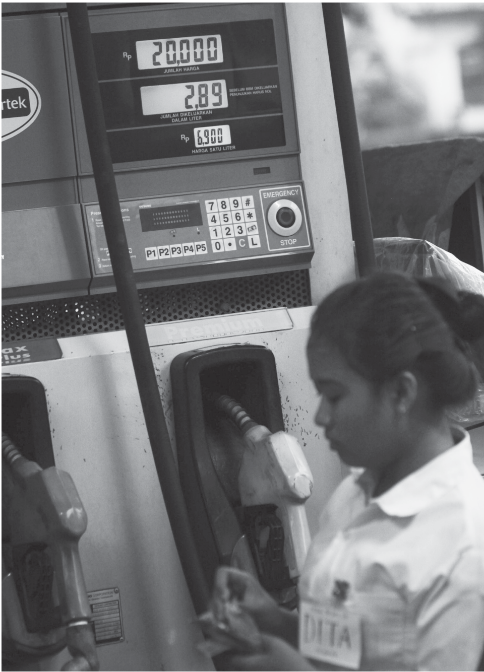
HARGA BARU: Salah satu SPBU di Surabaya yang sudah menerapkan harga baru jenis premium, kemarin.

Aden menuturkan, selain menindak tegas pihak-pihak yang melanggar, Pemkot perlu melakukan monitoring secara terus-menerus melalui dishub dan satpol PP. Dinas cipta karya dan tata ruang juga harus bersikap tegas dengan tidak mengeluarkan perizinan kepada pihak mana pun apabila dalam pembangunan gedung perkantoran atau pusat perbelanjaan, manajemen tidak menyediakan fasilitas off street parking yang cukup dan memadai. ( wah/c1/iku )