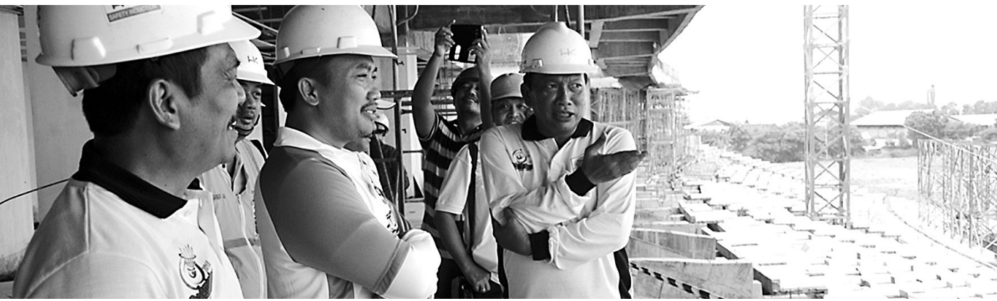
TINJAU : Bupati Sambari Halim Radianto dan Wabup Qosim saat mendampingi Menpora Imam Nahrawi, meninjau Stadion Lengis.

Sementara itu, harga beras di beberapa pasar yang ada di Kabupaten Gresik ternyata terus merangkak naik. Seperti yang terlihat di Pasar Gresik, harga beras Bengawan saat ini sudah menembus angka Rp 13 ribu per kilo-