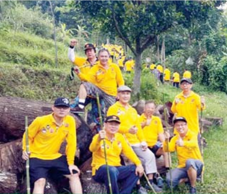
ISTIRAHAT: Istirahat sejenak untuk menjaga stamina.