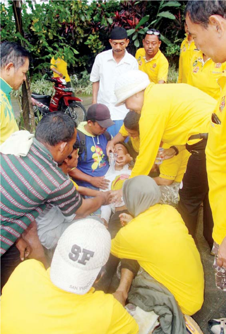
PINGSAN: Salah satu peserta ada yang pinsan.