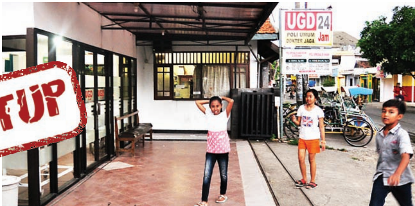
MASIH BUKA : Meski dinyatakan ditutup, operasional di RSIA Nyai Ageng Pinatih tetap buka pada Minggu sore.

KEBOMAS - Dinas Kesehatan (Dinkes) Gresik akhirnya menutup operasional dan pelayanan medis Rumah Sakit Ibu dan Anak (RSIA) Nyai Ageng Pinatih. Surat penghentian operasional rumah sakit dilayangkan dinkes sejak Kamis (26/2), pekan lalu. Kepala Dinas Kesehatan Gresik, dr Soe-geng Widodo menga-takan, surat larangan operasi bagi RSIA Nyai Ageng pinatih sudah dilun-curkan. Surat tersebut, berlaku hingga surat izin operasional diterbitkan oleh dinkes. “Selama izin operasional belum