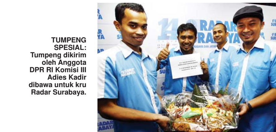
TUMPENG SPESIAL: Tumpeng dikirim oleh Anggota DPR RI Komisi III Adies Kadir dibawa untuk kru Radar Surabaya.