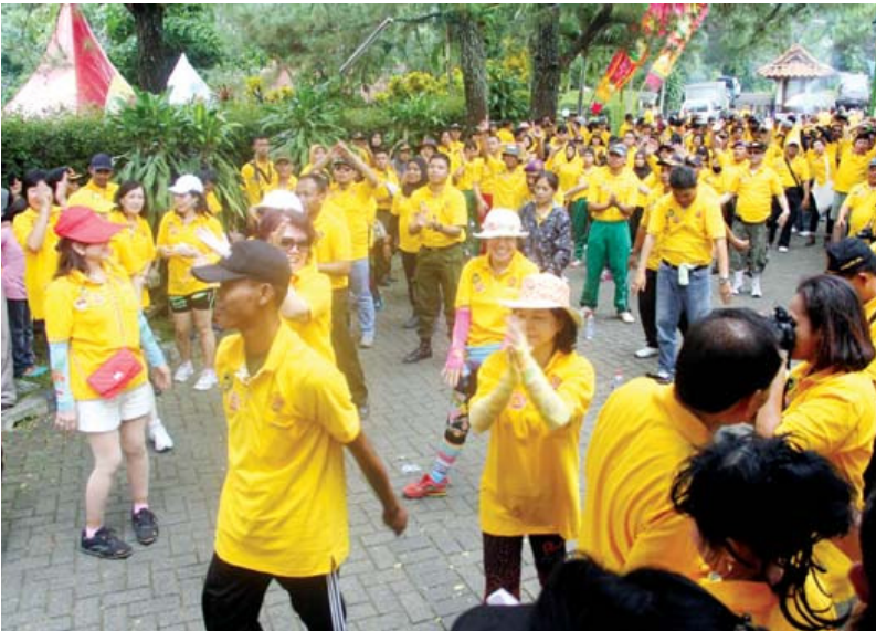
SEMANGAT: “Ayo semangat, semangat,” teriak instruktur.