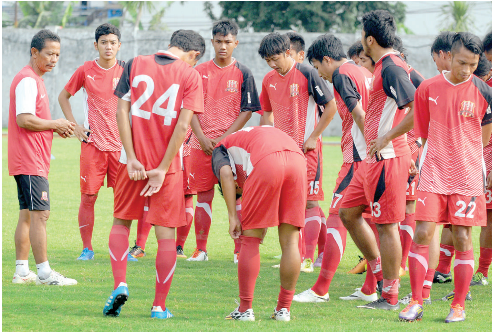
SKUAD MUDA: Pemain Deltras U-23 saat uji coba di Stadion Jenggolo, Sidoarjo.

Pedro menambahkan, tim voli yang dipersiapkan ke praprov ini juga akan melakukan serangkaian uji coba dengan beberapa tim yang dinilai kuat. Dengan begitu, tim voli Kota Delta lebih siap secara fisik dan mental. (vga/rek)