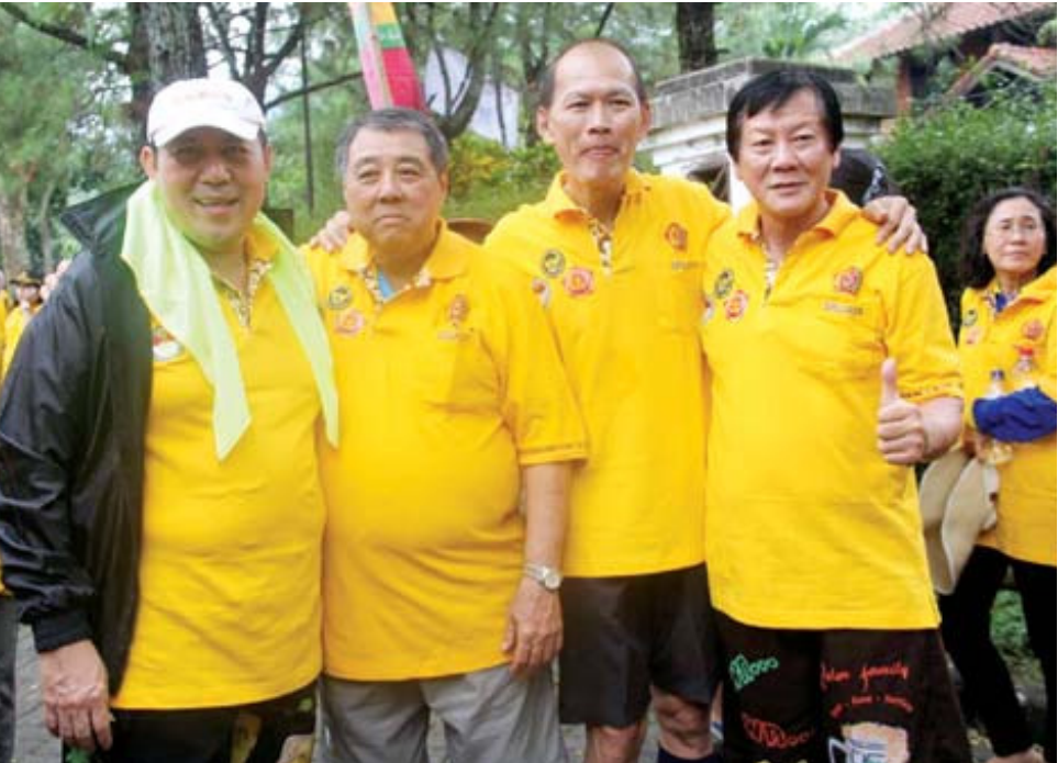
TAHES: Maski usia tua tetapi tetap ‘tahes’ (sehat).