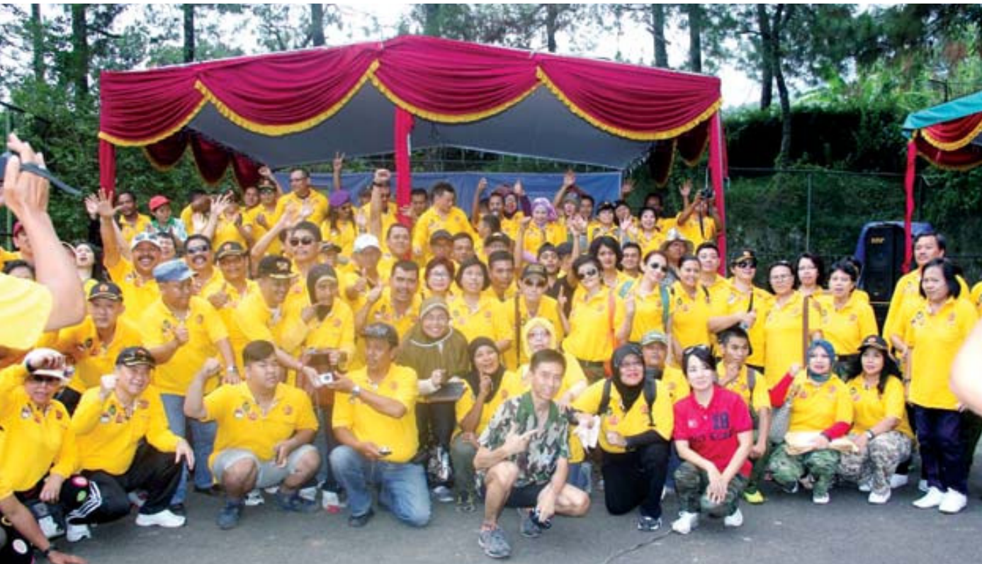
FOTO BERSAMA : Sebelum meninggalkan lokasi acara, seluruh peserta mengikuti sesi foto bersama. Meski sudah berkeringat mereka tetap ceria. Tidak ada yang murung dan cemberut.