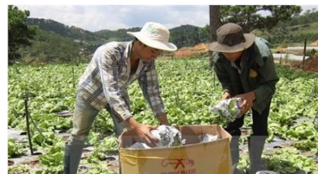
Thu hoạch rau an toàn ở Đà Lạt

Mô hình sản xuất nông nghiệp công nghệ cao, dây chuyền công nghệ tiên tiến trong chế biến sản phẩm nông nghiệp, đặc biệt là chế biến trà Olong, nuôi cá nước lạnh như áp dụng các mô hình nhà kính, nhà lưới, hệ thống tưới tự động, nhỏ giọt, công nghệ quản lý đang được nhiều doanh nghiệp, hộ nông dân áp dụng và nhân rộng, góp phần tăng giá trị hàng hóa của các sản phẩm nông nghiệp và công nghiệp chế biến nông sản, tăng giá trị sử dụng đất, góp phần tích cực trong việc phát triển kinh tế xã hội của tỉnh.