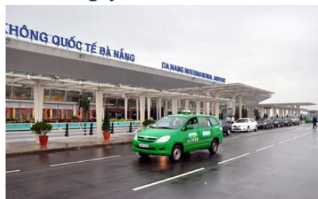
Sân bay quốc tế mới được nâng cấp từ năm 2011 hiện đã gần đạt công suất.

với các cơ quan của Bộ khẩn trương phê duyệt dự án, phê duyệt thiết kế ngay sau khi ACV trình.