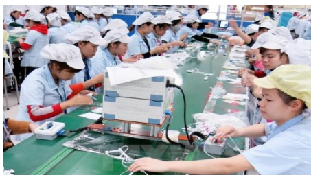
Dây chuyền sản xuất tại nghe cho điện thoại thông minh tại Công ty TNHH Glonics Việt Nam đóng tại Thái Nguyên

Sáng 6/4, tại Hà Nội, Viện Nghiên cứu quản lý kinh tế Trung ương (CIEM) tổ chức Hội thảo Điều kiện kinh doanh-kinh nghiệm quốc tế và thách thức đối với Việt Nam.