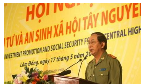
Đại tướng Trần Đại Quang, Ủy viên Bộ Chính trị, Bộ trưởng Bộ Công an, Trưởng Ban Chỉ đạo Tây Nguyên phát biểu chỉ đạo tại Hội nghị

Báo cáo tại Hội nghị cho biết, trong những năm qua, thu hút vốn đầu tư xã hội toàn vùng Tây Nguyên tăng nhanh, hệ thống kết cấu hạ tầng: giao thông, thủy lợi, y tế, giáo dục... của vùng đã có bước phát triển mới, thúc đẩy phát triển kinh tế- xã hội, đảm bảo quốc phòng, an ninh, cải thiện đời sống của nhân dân.