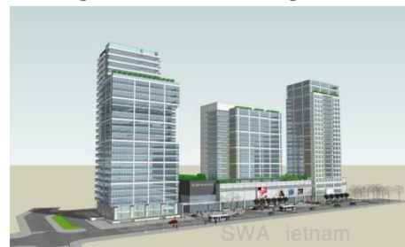
Phối cảnh TTTM Sài Gòn - Phú Gia

Ngày 07/5/2015, UBND tỉnh Bình Định đã chấp thuận chủ trương cho Công ty TNHH Thương mại Xuất nhập khẩu Nông sản Quốc tế (có trụ sở tại thành phố Hồ Chí Minh) triển khai các thủ tục đầu tư xây dựng dự án Khu thương mại và khu chung cư.