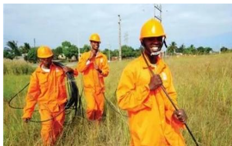
Hiện Viettel đã đầu tư tại 9 quốc gia với tổng dân số 175 triệu dân, gần gấp đôi dân số Việt Nam

Các dự án đầu tư ra nước ngoài (ĐTRNN) có vốn đầu tư dưới 800 tỷ đồng sẽ chỉ cần đăng ký đầu tư với cơ quan quản lý. Quy định như vậy là rất thoáng, song bù lại, việc giám sát các hoạt động đầu tư này sẽ chặt hơn.