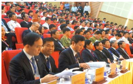
Các đại biểu dự Hội nghị