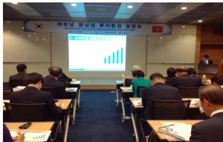
Quang cảnh hội thảo