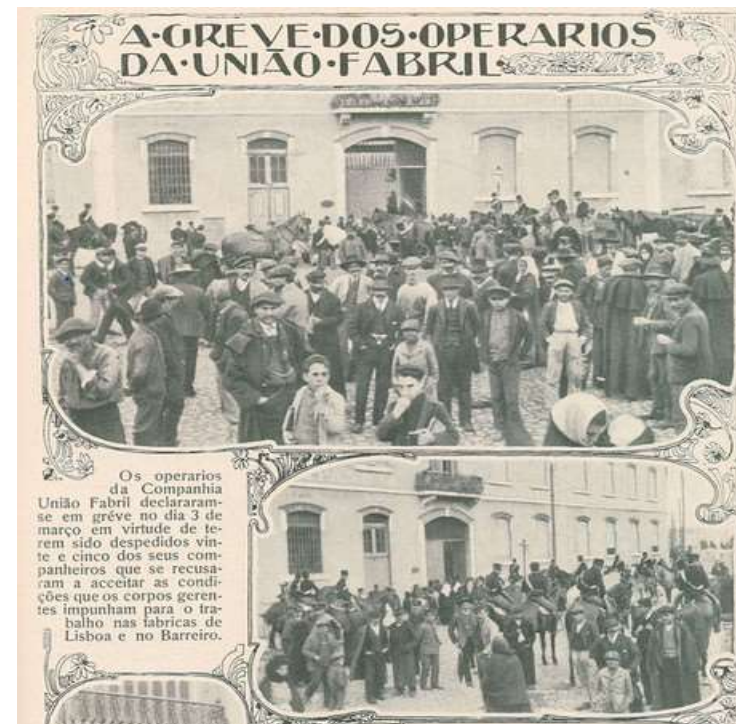
Alcântara – Lisboa (1911)